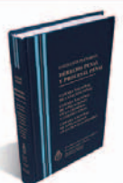
DERECHO PENAL Y PROCESAL PENAL