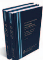
DERECHO DEL TRABAJO