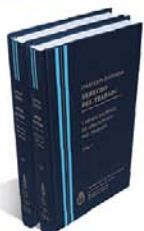
DERECHO DEL TRABAJO