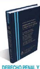
DERECHO PENAL Y PROCESAL PENAL