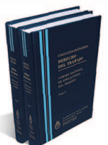
DERECHO DEL TRABAJO