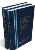
DERECHO DEL TRABAJO