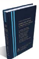
DERECHO PENAL Y PROCESAL PENAL