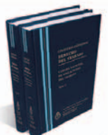
DERECHO DEL TRABAJO