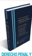
DERECHO PENAL Y PROCESAL PENAL