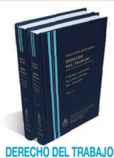
DERECHO DEL TRABAJO