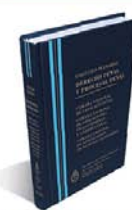
DERECHO PENAL Y PROCESAL PENAL