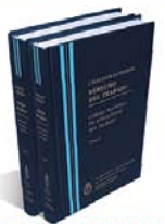
DERECHO DEL TRABAJO