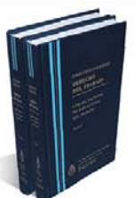
DERECHO DEL TRABAJO