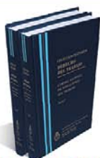
DERECHO DEL TRABAJO