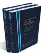
DERECHO DEL TRABAJO