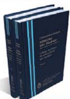
DERECHO DEL TRABAJO