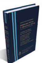
DERECHO PENAL Y PROCESAL PENAL